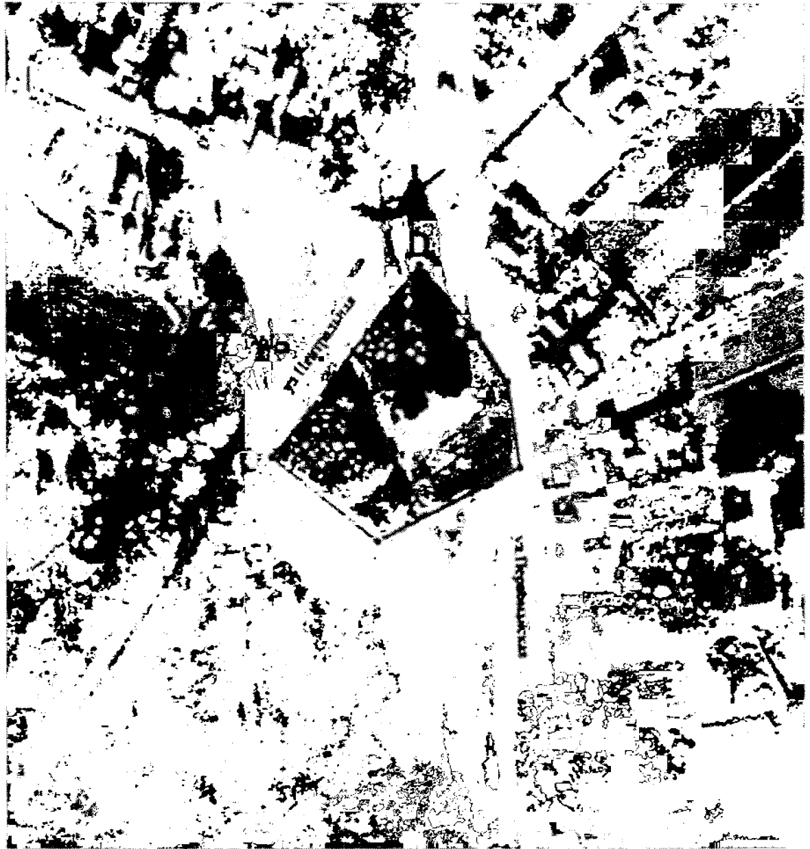
Схема границ территории объекта культурного наследия регионального значения «Казанская церковь»